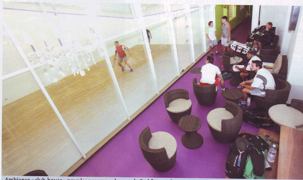
Ambiance « club-house » pour les nouveaux locaux de Bad & squash.

Bad & squash, c'est l'union de deux sports de raquettes: le badminton* et le squash. Zoom sur le squash, un sport qui ne cesse de faire des émules. À découvrir à La Garenne!